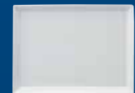
PLAT CARRÉE PIATTO RETTANGOLARE FUENTE ESQUINADA