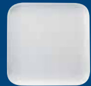
ASSIETTE PLATE COUPE CARRÉE PIATTO PIANO QUADRO COUPE PLATO LLANO COUPE ESQUINADO