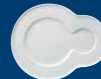
PLAT À SNACK PIATTO SNACK PLATO SNACK