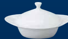
BOL OVALE AVEC COUVERCLE COPPETTA BANDEJA OVAL CON TAPA