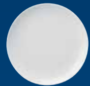
ASSIETTE PLATE COUPE PIATTO PIANO COUPE PLATO LLANO COUPE