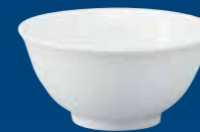
BOL À RIZ COPPETTA RISO BANDEJA DE ARROZ