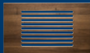
PLANCHE À PAIN 1/1 MARRON (BOIS) TAGLIERE PER IL PANE 1/1 MARRONE (LEGNO) TABLA DE CORTAR PARA PAN 1/1 MARRÓN (MADERAS)